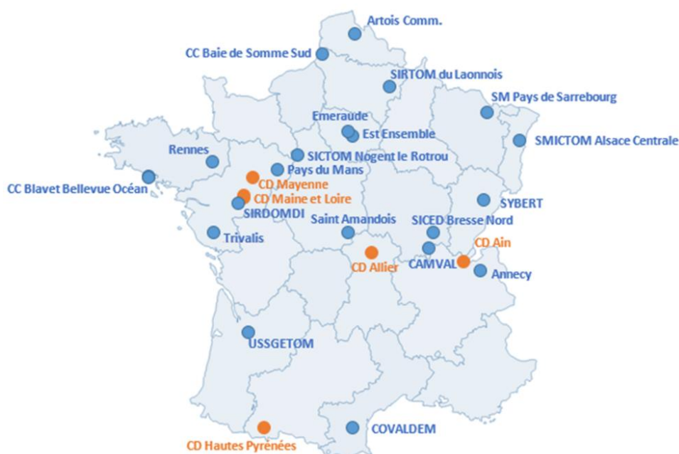
Cartographie des PLP (bleu) et des PTP (orange) réalisés sur les 3 ans d'étude

(soit toutes au-dessus de l'objectif de -7% fixé par les contrats d'objectifs avec l'ADEME)