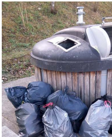
Figure 3. Dépôts de sacs d'OMR au pied d'un PAV.

Conformément aux indications des acteurs interrogés, les points d'apport volontaire sont les principaux lieux sujets à la présence de dépôts sauvages tous modes de financement confondus : parmi les 508 dépôts sauvages d'OMR recensés, 70 % des observations ont été effectuées à proximité d'un PAV (Figure 3).