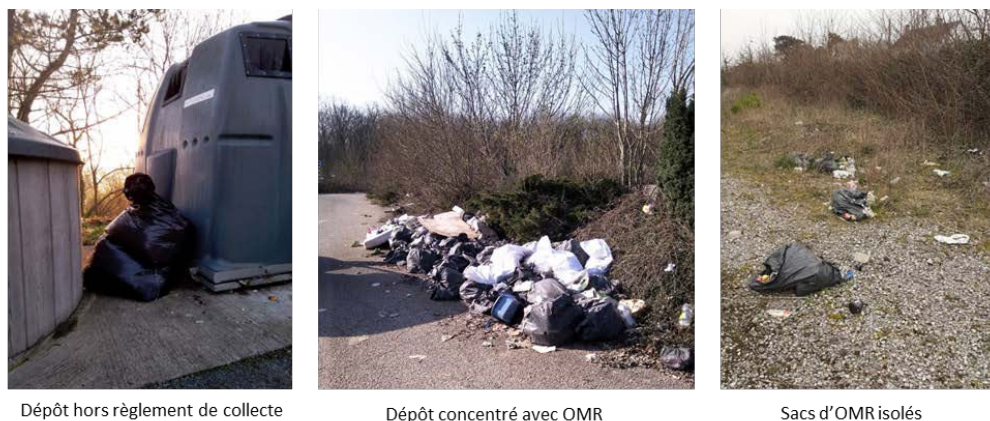
Figure 1. Typologie de déchets sauvages contenant des sacs d'OMR.

Le territoire d'étude concerne la France métropolitaine.